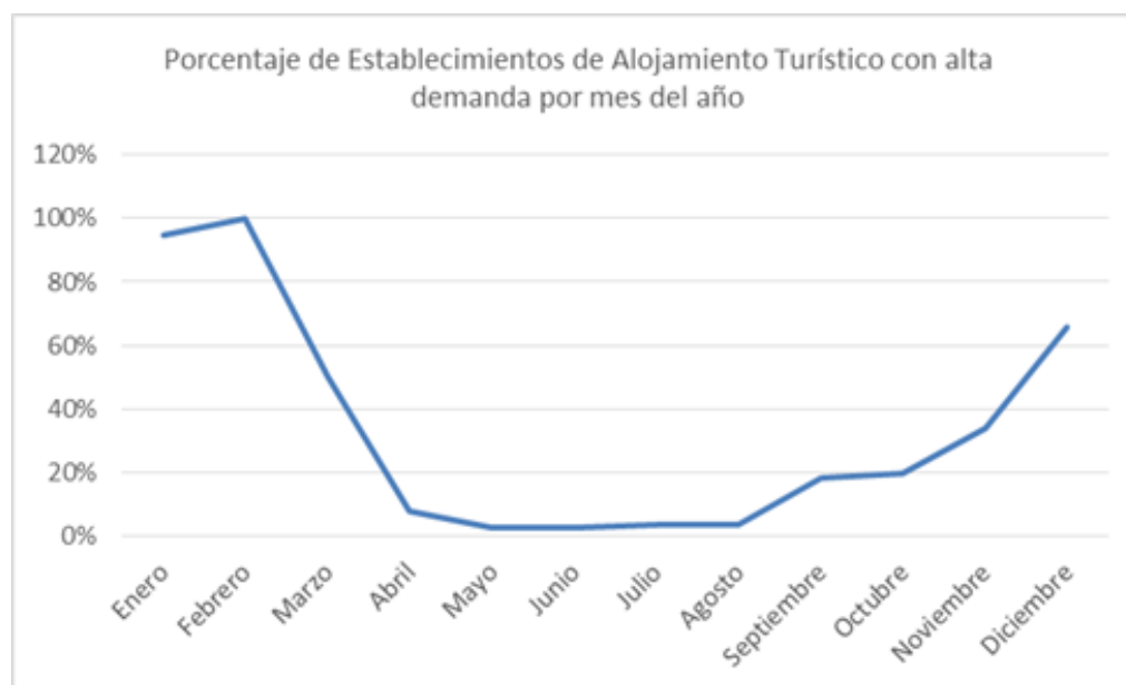
Gráfico Nº 4.35: Estacionalidad de la demanda en establecimientos de alojamiento turístico. Año 2013