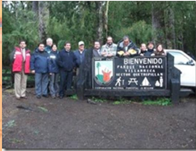
Reunión de coordinación para mejorar conectividad de Araucanía Lacustre con la Región de Los Ríos a través del P.N. Villarrica.