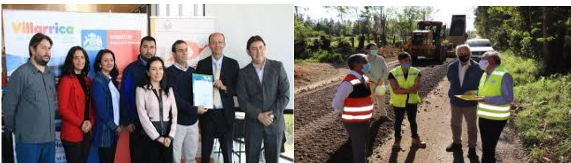
Equipos municipales en reunión con Seremi de Energía. Mejoramiento y mantención de caminos rurales destino Lacustre