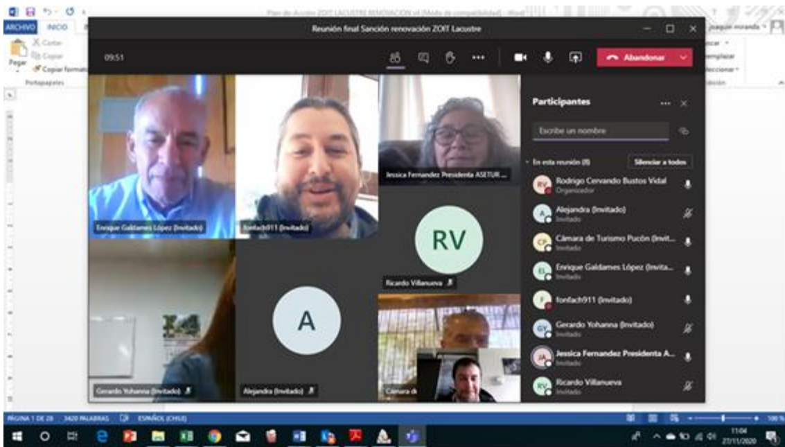
Reunión virtual Gobernanza Zoit Araucanía Lacubre