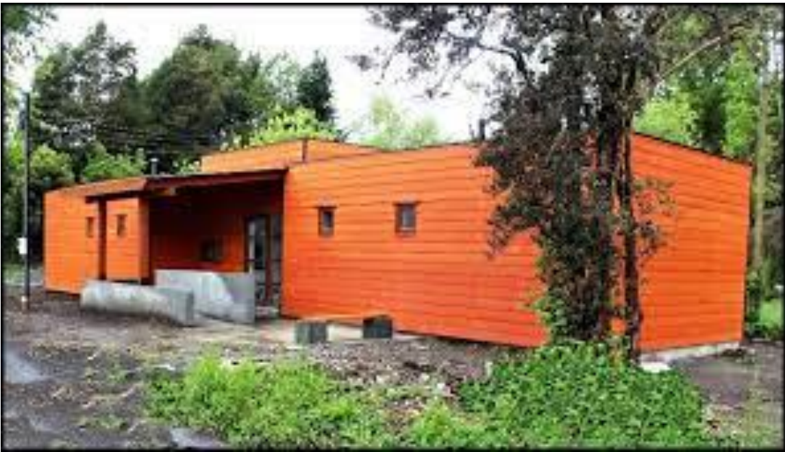
Habilitación de baños públicos en balneario de Licán Ray