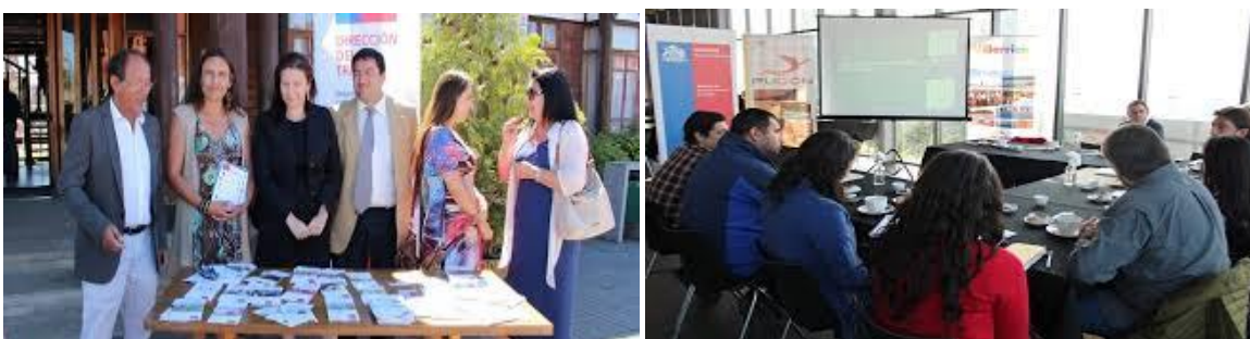
Entrega de materiales y folletería destino Araucanía Lacustre. Reunión de trabajo con equipos municipales Araucanía Lacustre