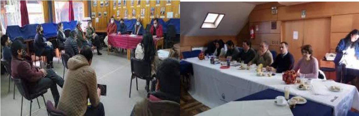
Reunión de la Gobernanza Zoit Araucanía Lacustre en Pucón