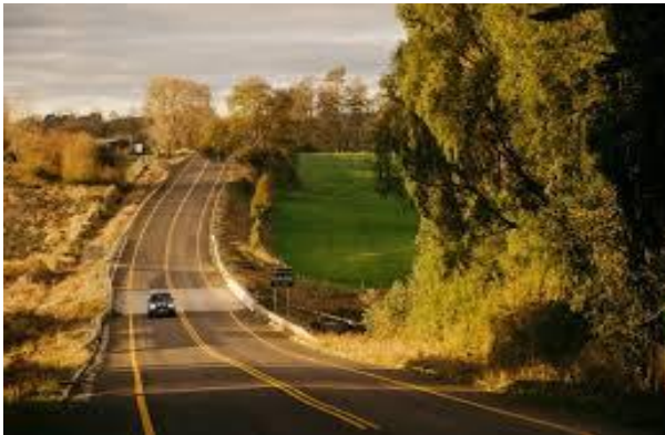
Asfaltado ruta Segunda Faja Villarrica – Pucón