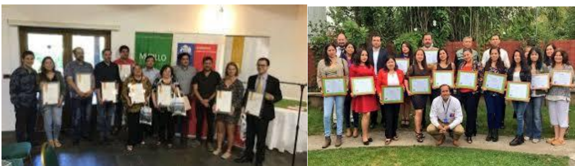
Capacitación en comercialización digital.