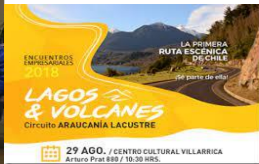
Empresarios se comprometen con Acuerdo de Producción Limpia. Encuentros empresariales