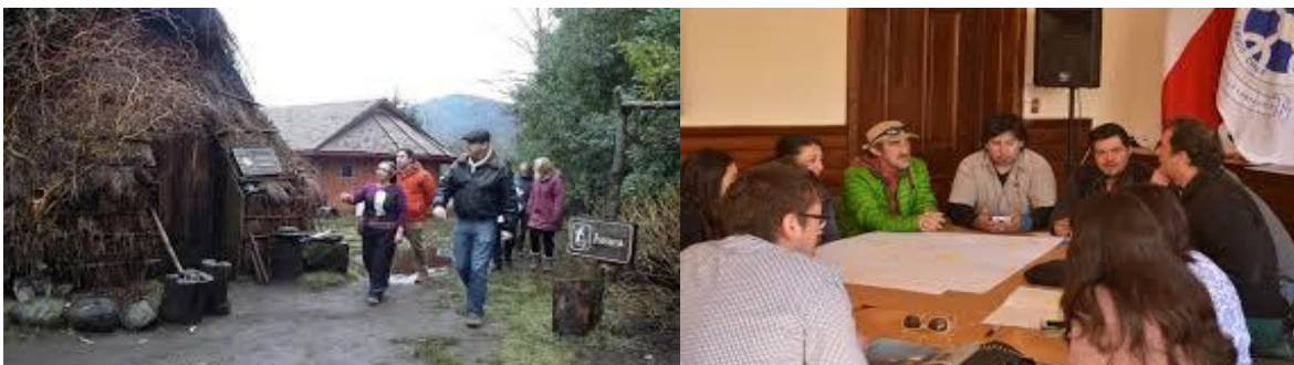
Intendente visita emprendimiento turístico mapuche en Pucón. Reunión de la Gobernanza público-privada Zoit Araucanía Lacustre

(presentar todos los medios de verificación de las acciones implementadas)