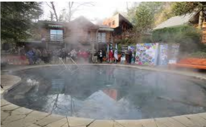
Inicio mes de las Termas en Termas Huife

Tradicional actividad ahora tiene su propia caseta de información y bodega en embarcadero de la ciudad lacustre. La buena noticia viene a contrarrestar una temporada estival con menos clientes.