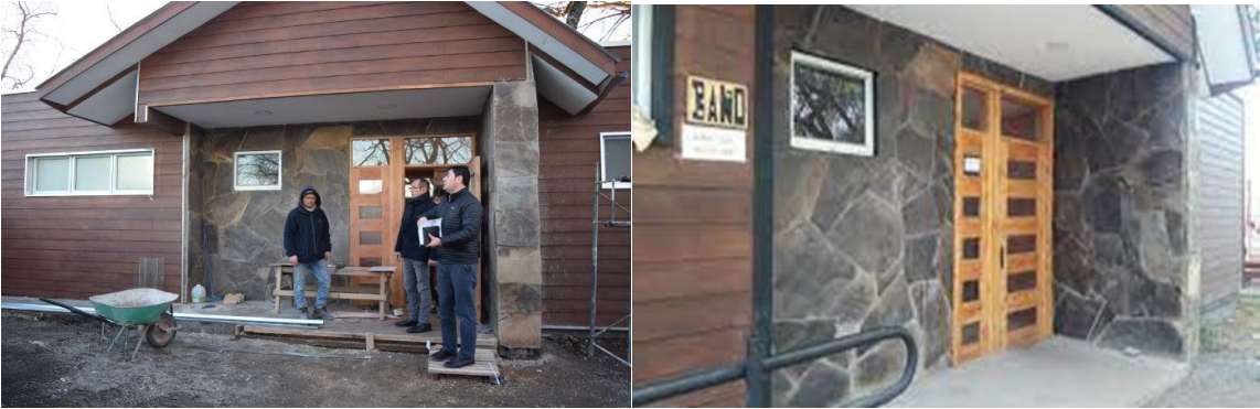
Habilitación de baños en playa de Villarrica