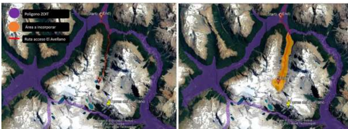
Figura 2: Incorporación área Ruta de acceso Torres del Avellano

En torno al lugar en cuestión se desarrollando una creciente actividad asociada al montañismo y escalada. El área de El Avellano, puntualmente “las Torres del Avellano” cuenta con reconocimiento principalmente a nivel internacional 2 . No obstante, lo anterior, la actividad turística asociada a este atractivo (y a esta ruta de acceso en particular) se está dando de manera espontánea, generando problemas principalmente asociados a la seguridad de quienes visitan el área, más algunos focos menores de contaminación y problemas con pobladores del lugar. Si bien existen operadores locales, debidamente registrados en Sernatur, trabajando en el área de manera coordinada con pobladores, se requiere apoyar de manera coordinada el desarrollo de la actividad en el sector.