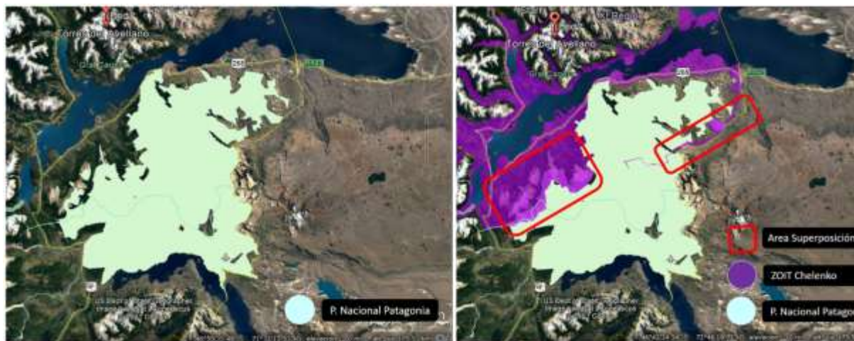
Figura 1. Disminución superficie polígono ZOIT Chelenko por ajuste a limite PN Patagonia

Al crearse el actual parque Patagonia se fusionaron la ex Reserva Nacional Lago Jeinimeni y la ex Reserva Nacional Lago Cochrane (Tamango); incluyendo el sector de Valle Chacabuco. Además, se sumaron nuevas áreas, y con ello la nueva ASP creada, contempla una superficie mayor a la original, superponiéndose al polígono ZOIT Chelenko en el área Sur de la localidad de Pto. Guadal y camino acceso al área de administración del área Jeinimeni del PN Patagonia. De esta manera y con el objeto de apegarse a la normativa se resta al polígono ZOIT original, el área de superposición con PN Patagonia.