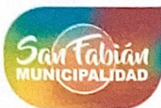
Ilustración 1. Imagen Objetivo PLADECO San Fabián 2020 - 2025